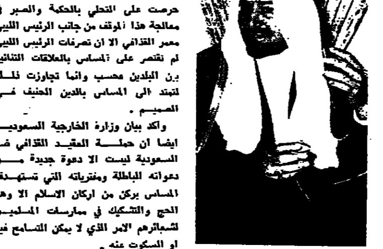
العراق وایران يستجيبان لاقتراح ارسال وفد عن دول عدم الانحياز

نيويورك - ذكرت مصادر دبلوماسية هنا امس ان العراق وايران استجابا لاقتراح ارسال وفد عن مجموعة دول عدم الانحياز الى كل من بغداد وطهران في محاولة ليجاد تسوية للنزاع بين البلدين .